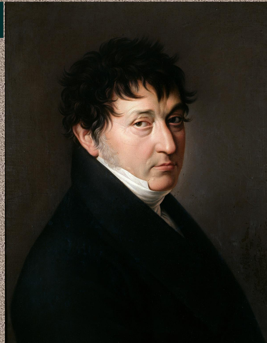
Zacarías González Velázquez. Autoretrato . Hacia 1810-1813. Óleo sobre lienzo. 59 x 46 cm. Museo Nacional del Prado (P07492), Madrid.