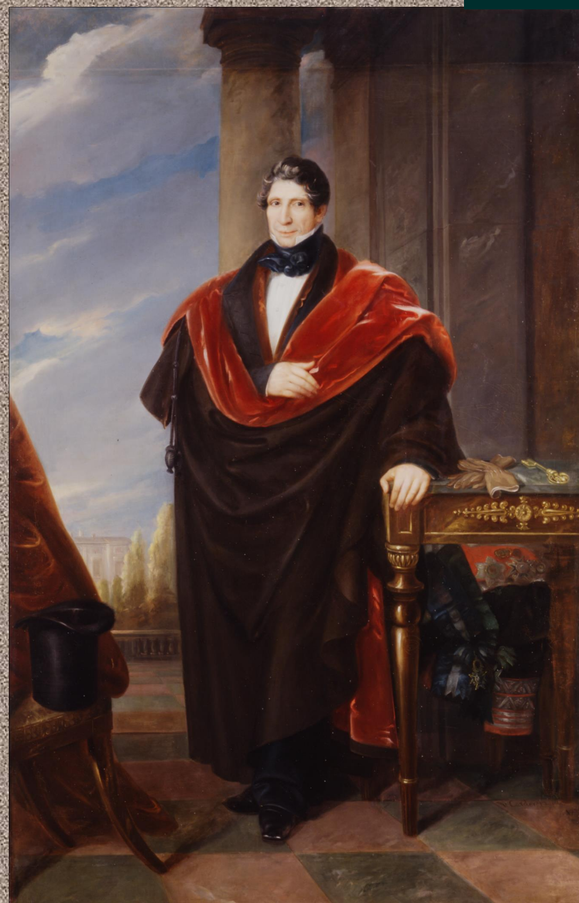
Inv. VH 0496 Valentín Carderera y Solano Fernando de Aguilera y Contreras XV Marqués de Cerralbo Óleo sobre lienzo, 216 x 138 cm