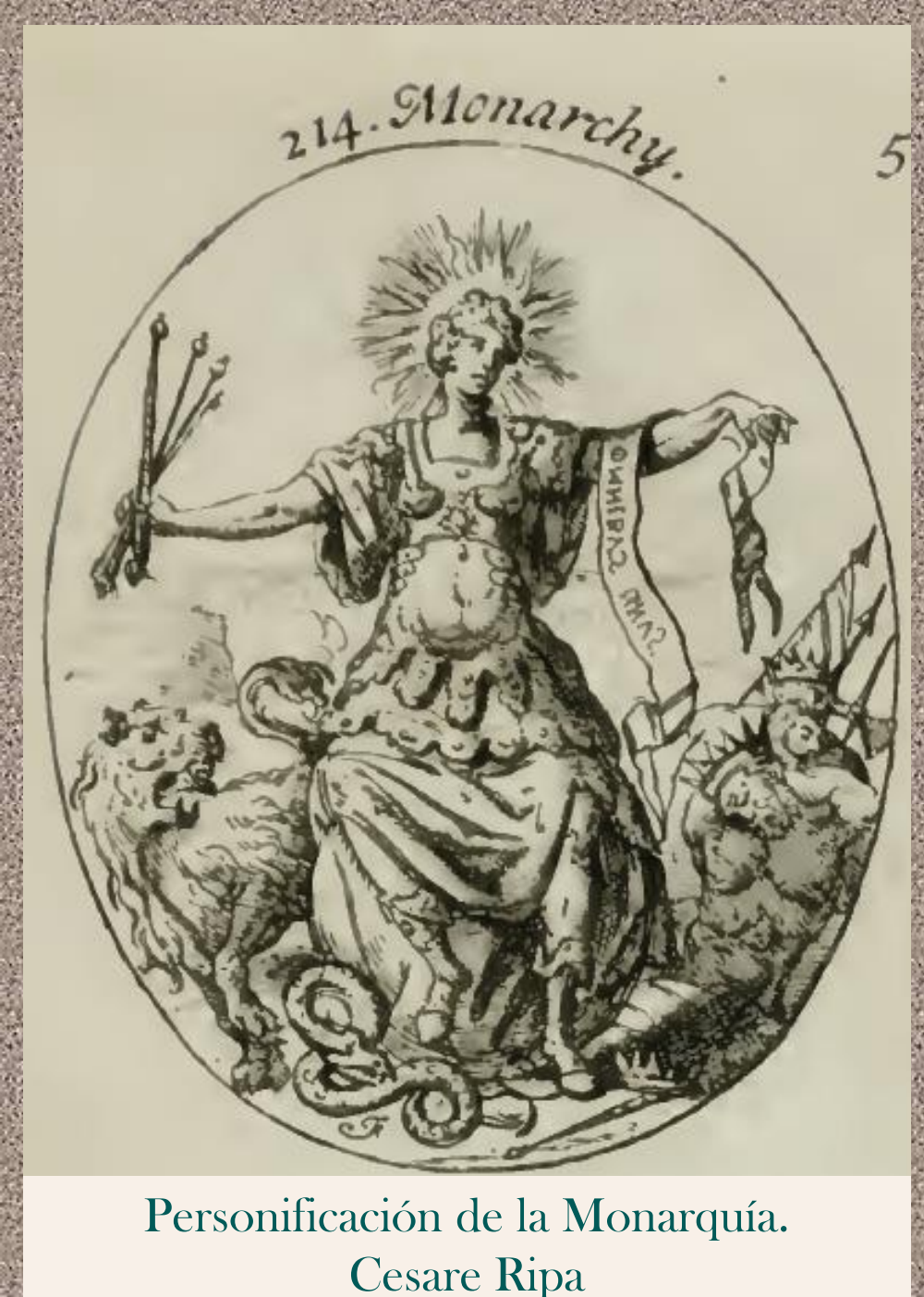
Personificación de la Monarquía. Cesare Ripa