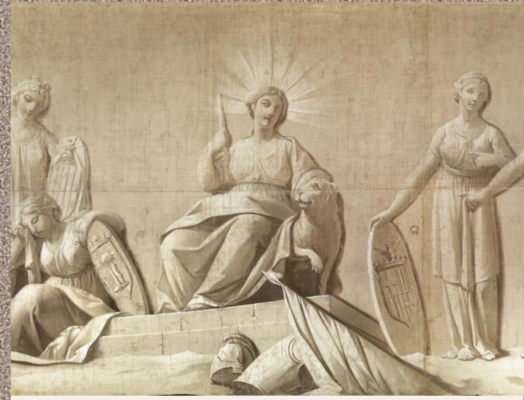
Zacarías González Velázquez. Cortejo fúnebre de María Isabel de Braganza (detalle) , 1819. Aguazo sobre sarga (tafetán). 167 x 1.300 cm. Museo Cerralbo (inv. 5598).