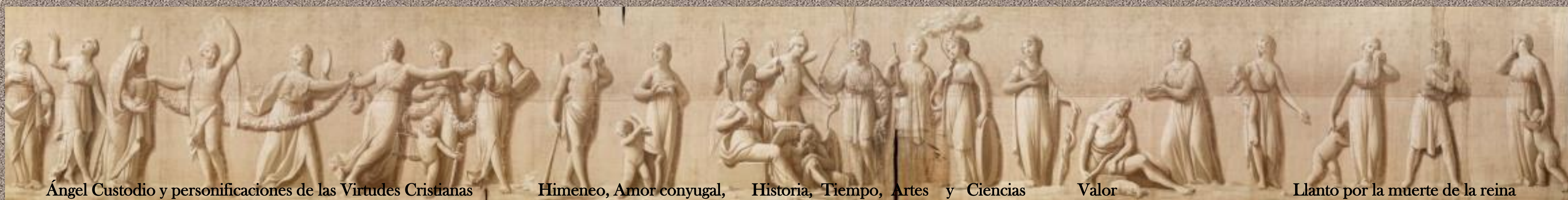
Ángel Custodio y personificaciones de las Virtudes Cristianas