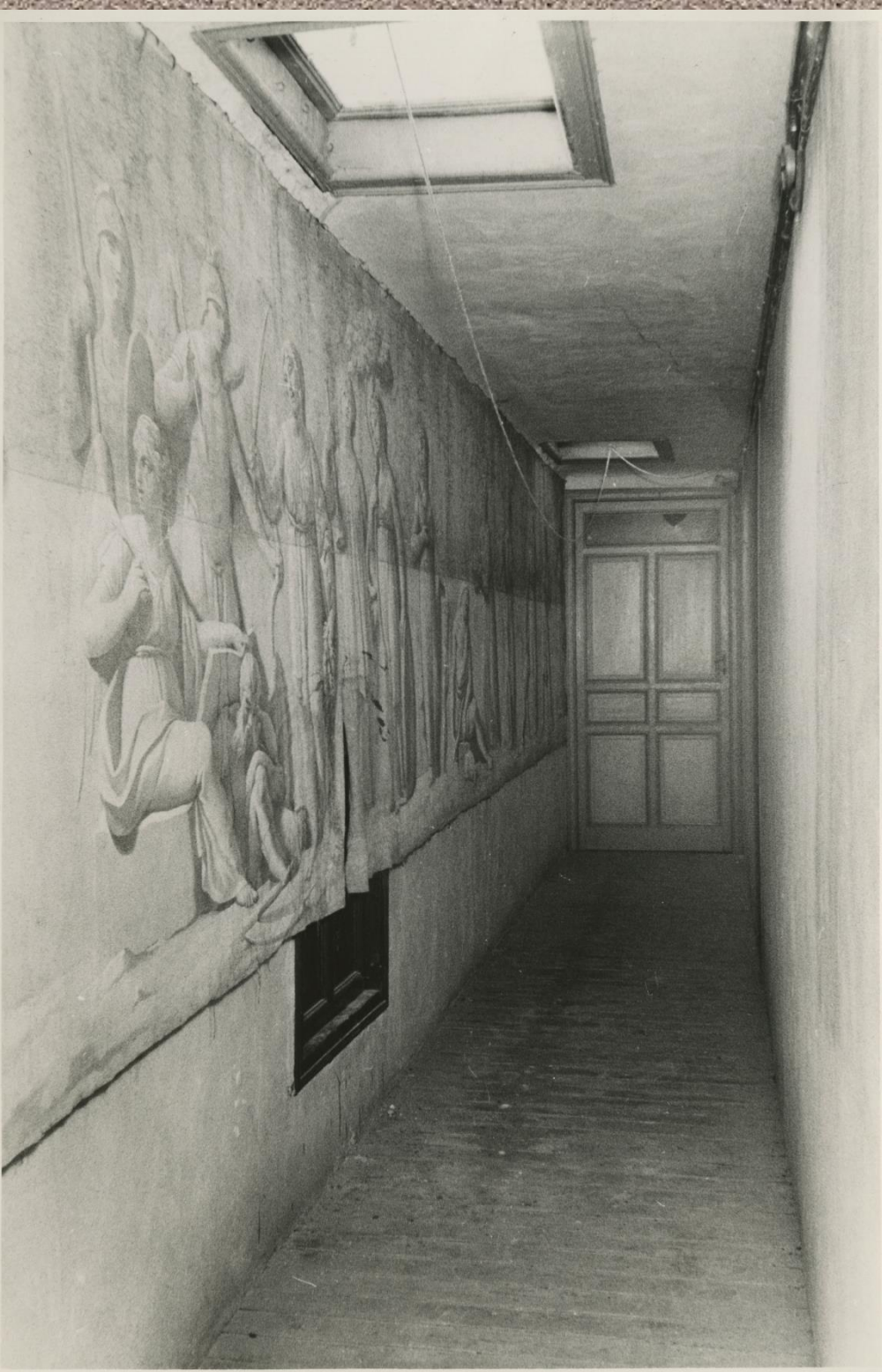
Invs. 05598 y 05599 (1819) Instalación de la sarga de Zacarías González Velázquez en el Museo Cerralbo Pasillo, ventanales y puerta del piso 3º Otto Wunderlich, 1941 1,67 m alto x 23,89 m largo