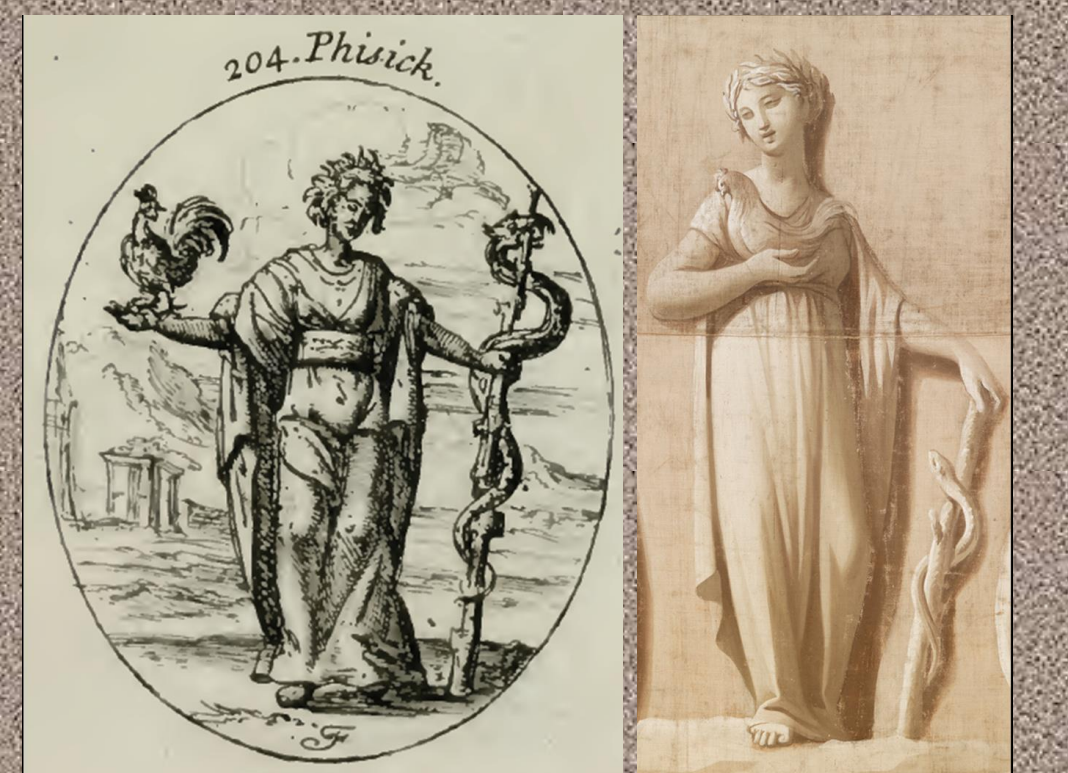
Personificación de la Medicina, según modelo de Ripa