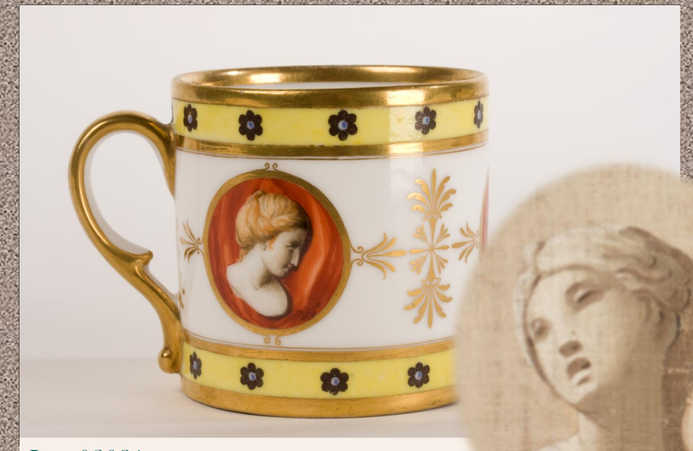
Inv. 02031 Taza Real Fábrica del Buen Retiro Decorador: Cástor González Velázquez Museo Cerralbo, Madrid 7 alt x 8 diám com