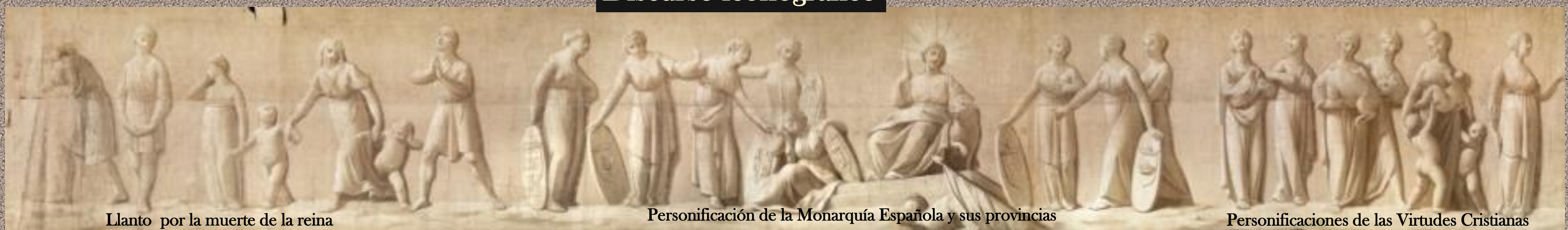
Llanto por la muerte de la reina