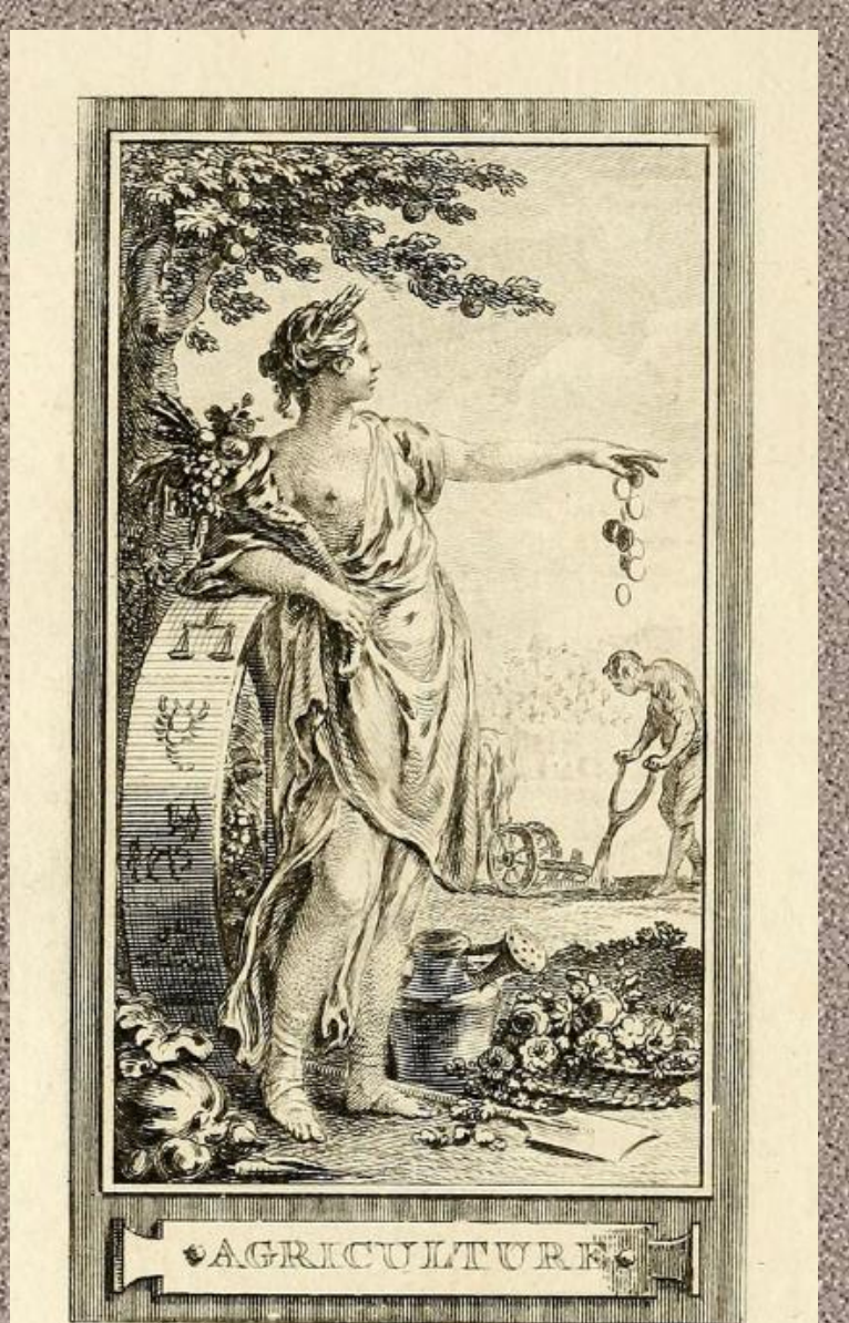
Personificación de la Agricultura. Gravelot