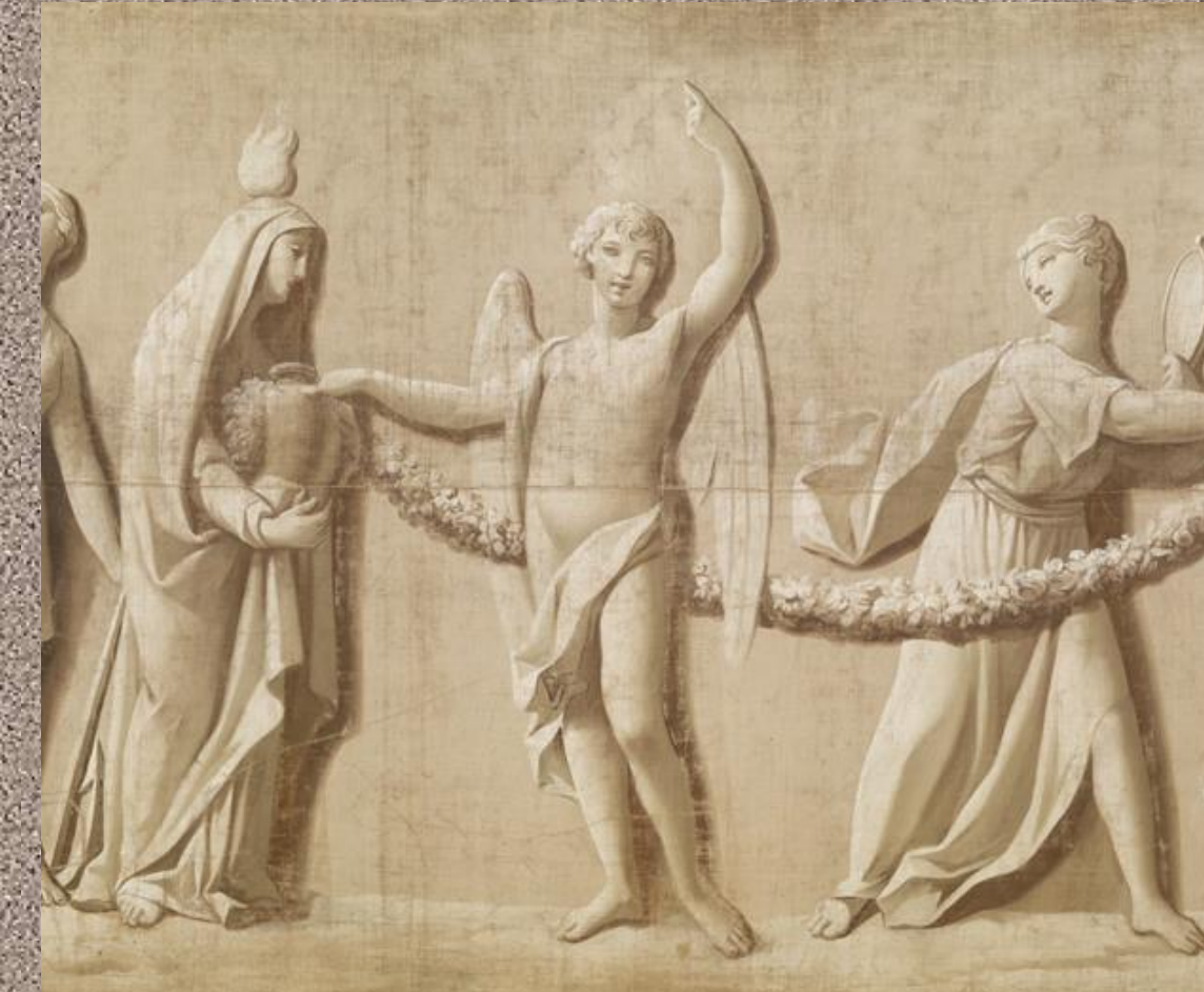
Zacarías González Velázquez. Cortejo fúnebre de María Isabel de Braganza (detalle) , 1819. Aguazo sobre sarga (tafetán). 167 x 1.300 cm. Museo Cerralbo (inv. 5598).